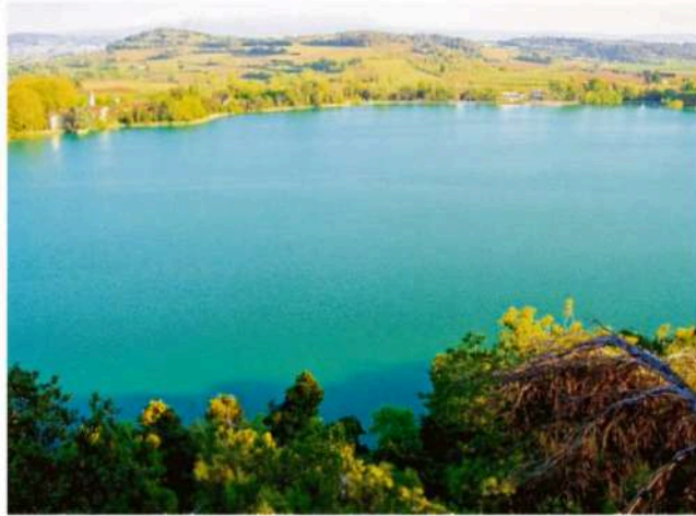
Le domaine de l'Étang de la Bonde est un vaste terrain de 964 656 m 2 qui regroupe des terres agricoles, des espaces forestiers, un étang et des bâtiments pour un prix de 10 millions d'euros.